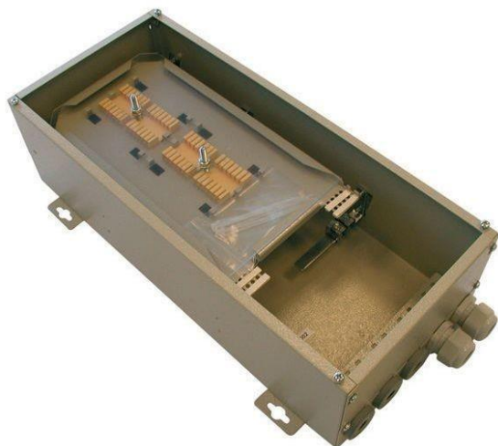
Gnybto ilgiklis TT-96-691696